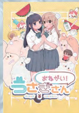
東京校作品 おねがい! うさぎさん

総合学科アニメプロデュースコースおよびアニメーション学科では、卒業年次にアニメーション作品を制作します。監督、シナリオ、絵コンテ、動画検査、仕上、撮影、制作進行など各自担当を決め、5～10分間のショートアニメーションを制作します。アニメーションに特化した本校ならではの強みを活かし、例年、声優学科からキャストを選出してアフレコを行いひとつの作品を完成させます。