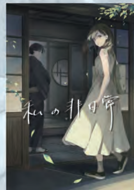
大阪校作品 私の非日常